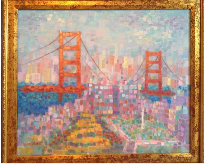
李慧新〈Union “Square” 舊金山〉