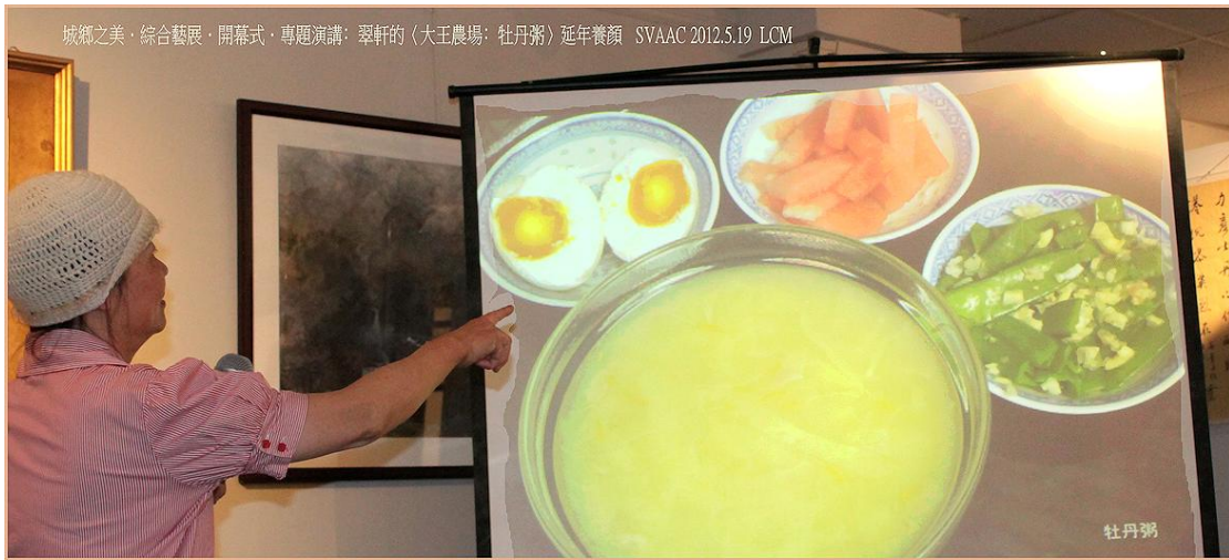
大王農場·翠軒的“養顏入畫 牡丹粥”