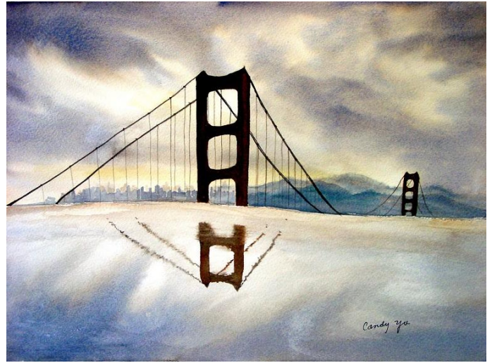
林玉雪〈雲漫金山橋〉